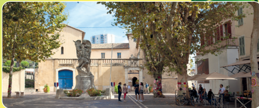
Entrée du musée national Pablo Picasso, La Guerre et la Paix, à Vallauris. Photo : musées nationaux du XXe siècle des Alpes-Maritimes / Gilles Ehrentrant, 2021.