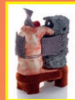
Laurent Nicolas Inonotus 2023 H. 62 cm x L. 44 cm x l. 30 cm Grès blanc, porcelaine, bois et corde - France Grand prix de la Ville de Vallauris Sylvain Deleu

Le parcours auquel sont invités les visiteurs permet, au travers d'une scénographie adaptée à la variété formelle des 35 œuvres présentées, de leur offrir un panorama complet et exclusif du paysage de la création céramique contemporaine.